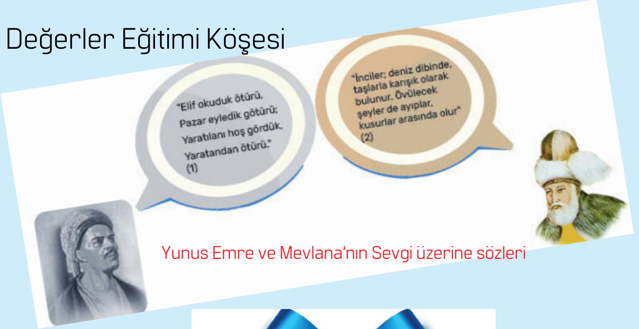
Yunus Emre ve Mevlana'nın Sevgi üzerine sözleri